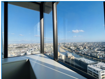
リビングからの実際の眺望です！